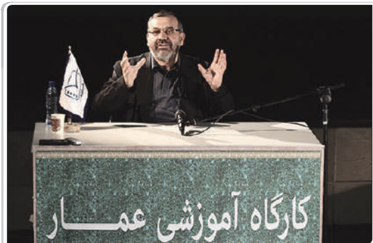
کارگاه آموزشی نیرومند در جشنواره عمار

(کارگردان بلند میشود و خودش می رود بیرون...)