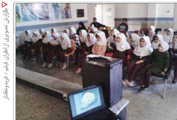
گزارش تصویری از اکران فیلم / فریدونکنار