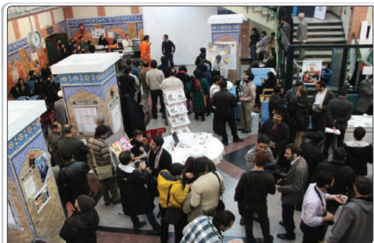
نمایی از لابی سینما فلسطین در جشنواره عمار