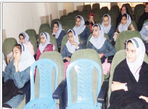
گزارش تصویری از اکران فیلم / شهری