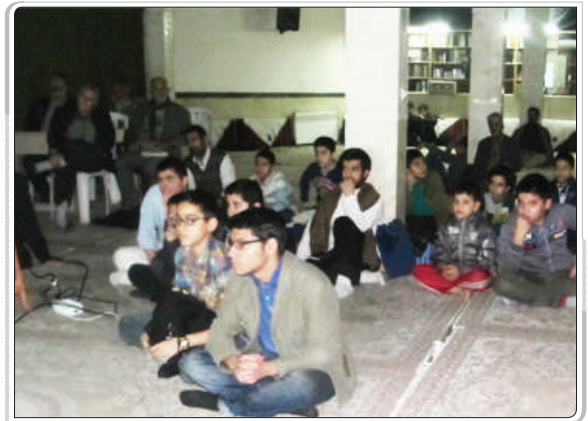
گزارش تصویری از اکران در چهارصد دستگاه تهران