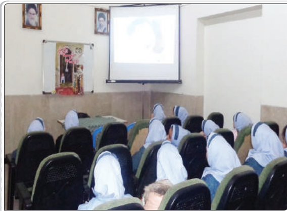
گزارش تصویری از اکران فیلم / شهری