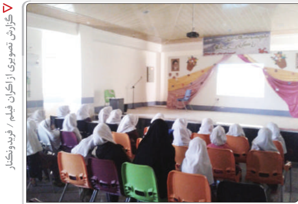
گزارش تصویری از اکران فیلم / فریدونکنار

شاه حسینی ضمن بررسی وضعیت فروش فیلم های سینمایی در گیشه در دوران قبل از انقلاب و ادعای مردمی بودن فیلم ها در آن روزگار به اکران فیلم مستند «خانه خدا» در آن روزها اشاره کرد و گفت: در حین اکران فیلم خانه خدا گروه انبوهی از مردم جامعه یک بار برای همیشه به سینما رفتند و فیلم دیدند. این فیلم در آن روزگار رکورد دار فروش بلیط سینما شد. در واقع بخش انبوهی از جامعه که به سینما نمی رفتند، برای دیدن این فیلم به سینما رفتند و بعد از آن هم دیگر به سینما نرفتند. در حین اکران این فیلم هم سینما دارها به صرافت افتادند و از سالن ها گندزدایی کردند. یعنی سالن آن روز سینما را که در برخی از آنها مشروبات الکلی فروخته می شد با روی درودیوار آن پوسته های نامناسب بود، به احترام مردم