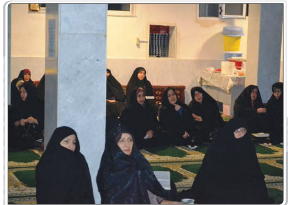
گزارش تصویری از مسجد پیامبر اعظم فومن