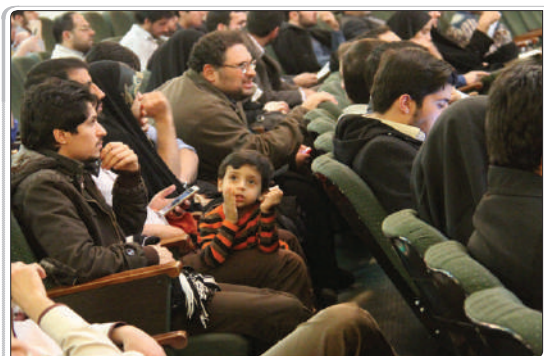
نمایی از سالن سینما فلسطین در جشنواره عمار