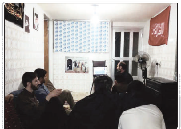
گزارش تصویری از اکران فیلمهای عمار / هشتگرد