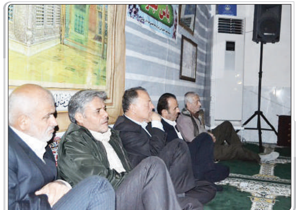
گزارش تصویری از مسجد پیامبر اعظم فومن