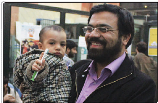
مجرى برنامه تریا در جشنواره عمار

کارگردان: این دفعه من به موقعیت شاد و امیدوار کننده می‌دم که دیگه نتونی بری تو اون فضاها! فرض کن توی یه امتحان خیلی مهم قبول شدی و خیلی خوشحالی. می‌فهمی؟ خوشحالی! همه چیز خوبه! حالا می‌خوای یه مهمونی بدی. یک کم این