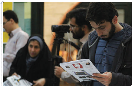
تشریه روزانه پنجمین جشنواره مردمی فیلم عمار