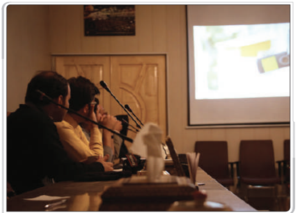
گزارش تصویری از اکران فیلم‌های عمار / سبزوار