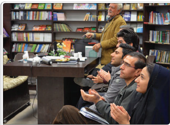
گزارش تصویری از اکران فیلم‌های عمار / شهرکرد