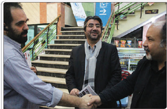
حضور رئیس مرکز گسترش سینمای مستند و تجربی در جشنواره عمار