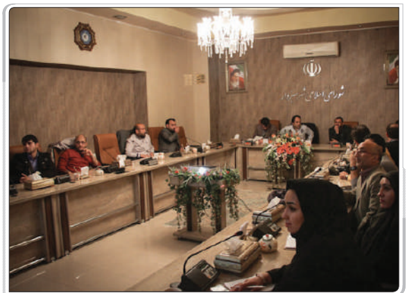
گزارش تصویری از اکران فیلم‌های عمار / سبزوار