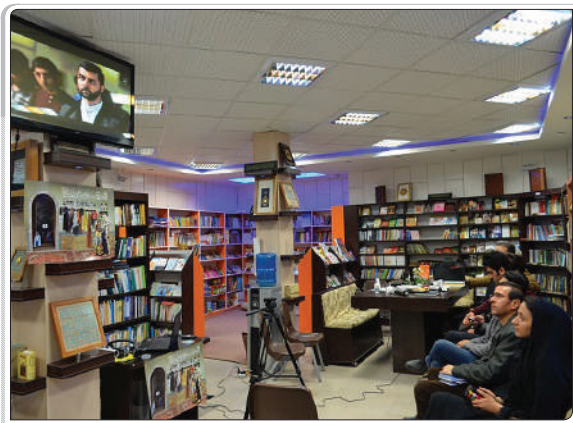
گزارش تصویری از اکران فیلم‌های عمار / شهرکرد