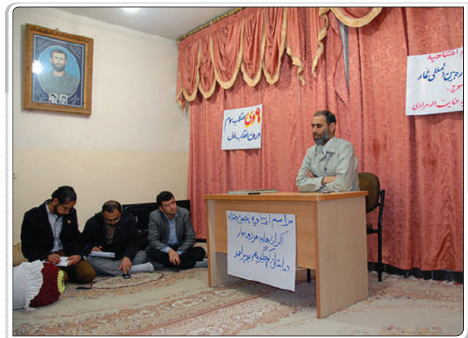
گزارش تصویری از کهمیکلوپه و پویر احمد / یاسوج