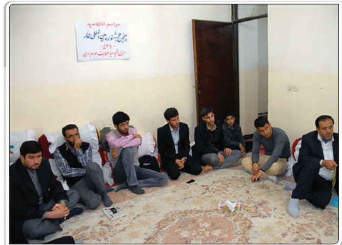
گزارش تصویری از کهمیکلوپه و پویر احمد / یاسوج