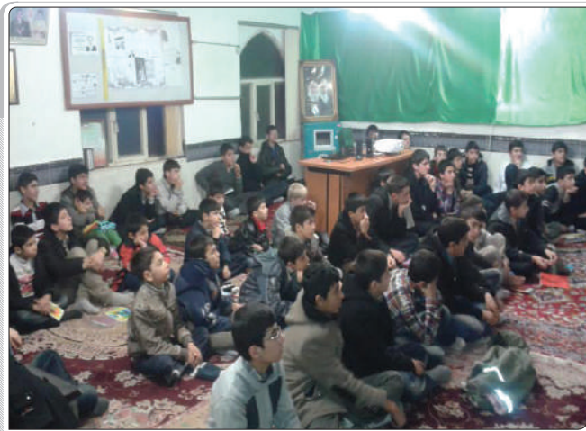
گزارش تصویری از اکران مردمی / مراغه