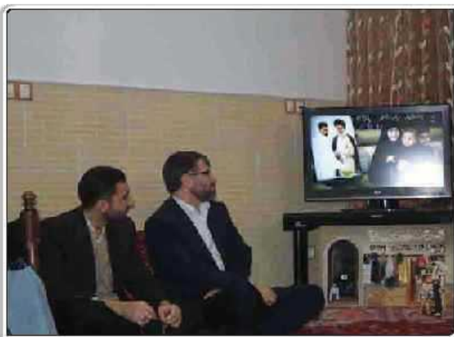
گزارش تصویری از اکران استان اصفهان / کاشان

این پدر شهید در ادامه خاطر نشان می‌کند: به هر جهت در زمانی که مشاهده می‌شود هنرمندان بی‌هنرا و برخی از افراد که هیچگونه تعهد رفتاری و عملی به کشور، دین، مذهب و انقلاب ندارند؛ برنامه‌ها و سمینارهای آنچنانی به راه می‌اندازند و در برخی روزنامه‌های همسویا خودشان در جهت تخریب وجهه انقلاب و نظام قلمفرسایی می‌