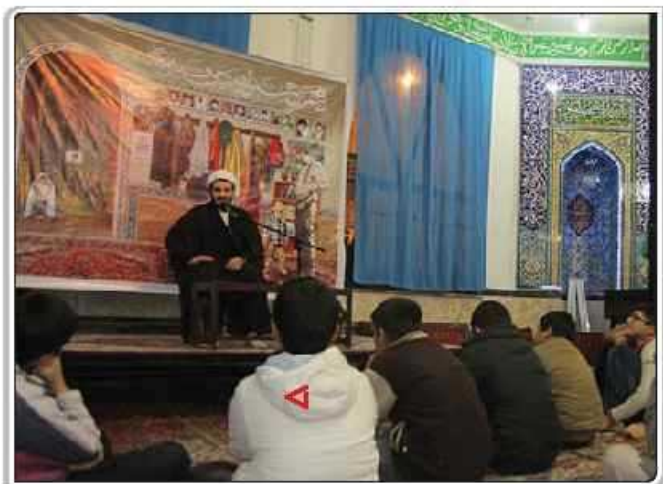
گزارش تصویری از استان گلستان / گنبد