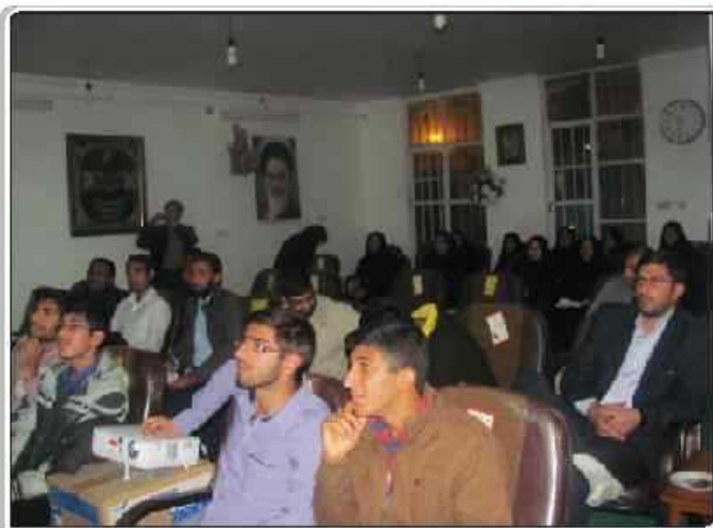
گزارش تصویری از اکران استان فارس / داراب