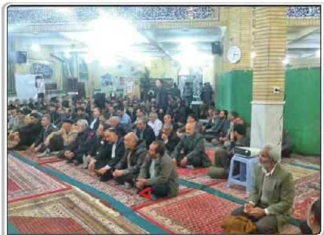
گزارش تصویری از اکران استان مرکزی / اراک